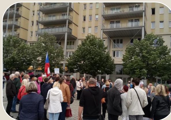
Z účasti na akci Miliónu chviliek pro demokracii v Mostě, červen 2020

https://www.hnutiommo.cz/l/politicke-hnuti-obcane-mestu-mesto-obcanum-ommo-deset-let-na-politicke-scene/